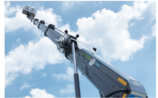
견고한 다각 설계로 붐 힘 개선