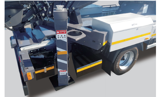
공간활용 적재함 추가적용