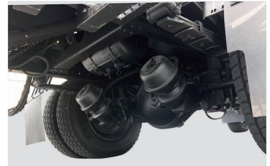
에어브레이크 타입 샤시 적용