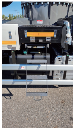
상/하차용 계단 적용