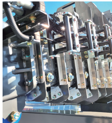
붐 내부 이물질 흡입방지용 솔 장치